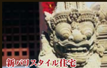
No.04 【新バリスタイル住宅】 浜松市東区 ＜インテリアコーディネート:Coast＞