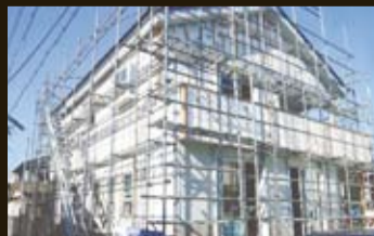
No.02 【洋風住宅】 浜松市中区 竜禅寺町