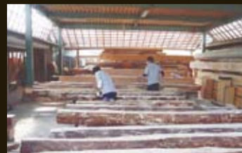
No.05 【洋風住宅】 浜松市北区 引佐 ＜竹小舞土壁下地＞