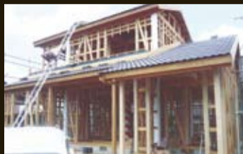
No.03 【新和風建築】 浜松市東区 市野町 ＜竹小舞土壁下地＞