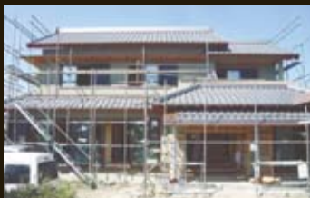
No.01 【和風建築】 浜松市浜北区 寺島 ＜竹小舞土壁下地＞